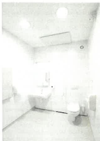
SZP-8 wc épület